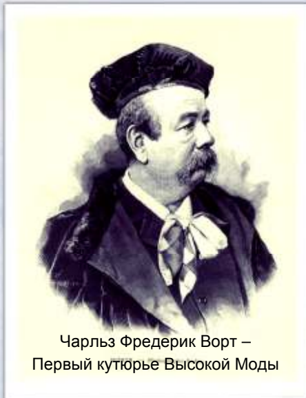
Чарльз Фредерик Ворт – Первый кутюрье Высокой Моды

Ворт был первым, кто начал диктовать своим клиентам свое видение моды. Он же первым ввел показы платьев на живых манекенщицах, отказавшись от распространенной тогда