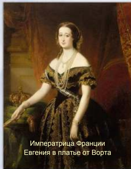
Императрица Франции Евгения в платье от Ворта

После Ворта традиции моды «от-кутюрье» продолжили парижские дизайнеры, имена которых навсегда остались в истории Высокой моды: Поль Пуаре, Коко Шанель, Мадлен Вионне,